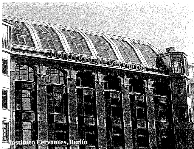
Instituto Cervantes, Berlín