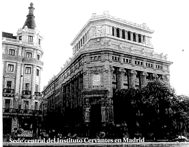
Sede central del Instituto Cervantes en Madrid