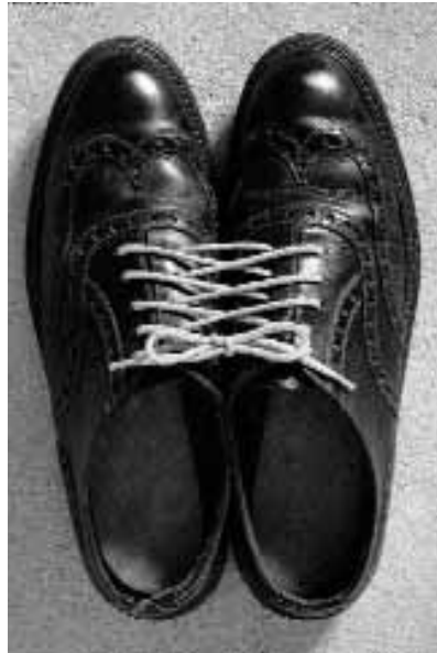
Fotografía de Chema Madoz.

«Analizando el azaroso mapa de señales que emiten las cosas desde el lugar que ocupan en el mundo, Madoz individualiza y desordena, confronta y manipula hasta conseguir mostrar un nuevo orden, una cara oculta del senti-