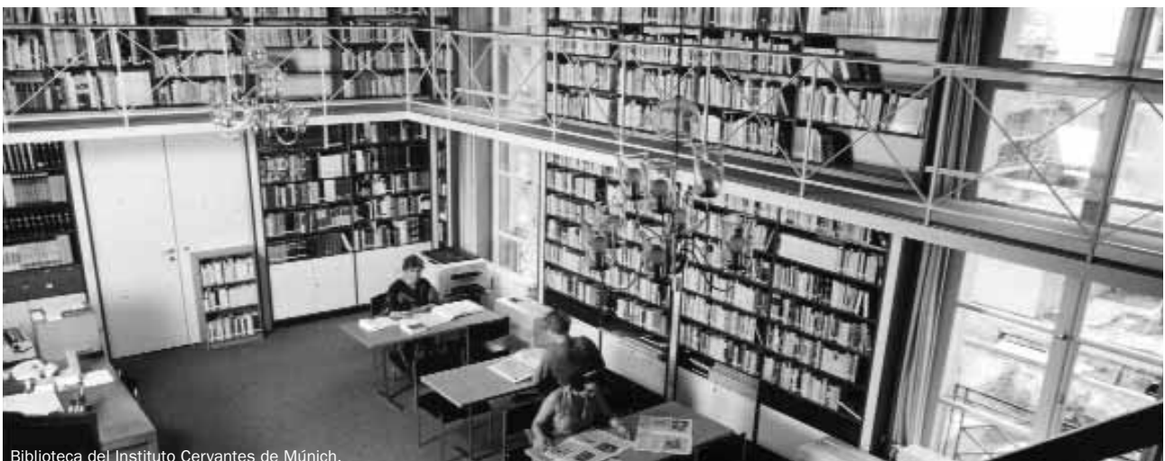
Biblioteca del Instituto Cervantes de Múnich.

Esta herramienta mejora notablemente la comunicación con el usuario, que puede interactuar de manera remota con la biblioteca, consultar sus préstamos, reservar y recibir una atención más personalizada. En definitiva, el nuevo programa supone un paso importante hacia la biblioteca del futuro.