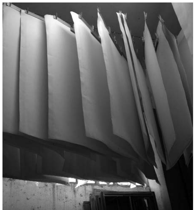
Papeles hechos a mano a base de algodón y lino, puestos a secar.