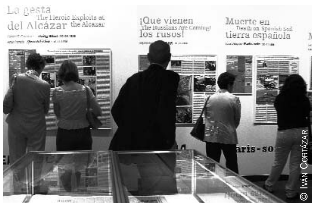
Público asistente a la exposición en el Instituto Cervantes de Nueva York.

En noviembre, la exposición visitará la nueva sede del Instituto Cervantes en Madrid, donde se acompañará de un programa de actividades que incluirá mesas redondas y un ciclo de cine.