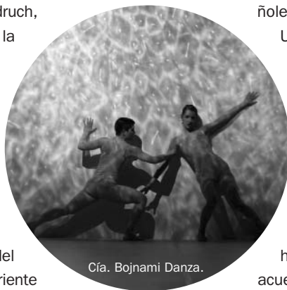
Cía. Bojnami Danza.