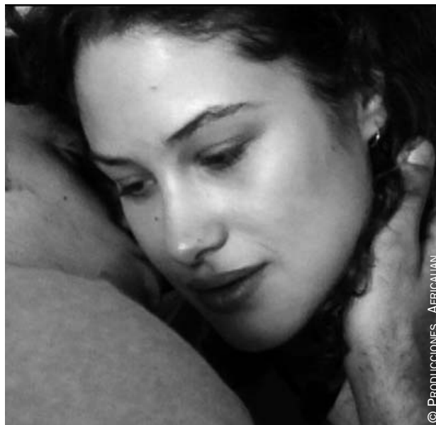
Fotograma del cortometraje Amar , exhibido en el festival «Curt Ficcions».

Por tercer año consecutivo, el festival de cine de cortometrajes «Curt Ficcions» presentará su selección de cortos en los cines de Europa Cinemas de París, Burdeos y Lyon durante el mes de noviembre, con la colaboración del Instituto Cervantes. Las exhibiciones estarán acompañadas por la presencia de algunos de los directores. La selección de este año presenta los cortos Choque , El punto ciego , Máxima pena , La gallina ciega , Hiyab , Strawberry Pie , Mártires , Amar y Sintonía .