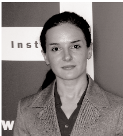
Por Eva González de Lucas, del Instituto Cervantes de Nueva Delhi

Considerado en nuestros días «idioma extranjero de prestigio», el español en la India cuenta con un lugar destacado entre las lenguas más solicitadas. La oferta de enseñanza de español como lengua extranjera, tanto institucional como privada, ha aumentado mucho en poco tiempo y promete multiplicarse en los próximos años.