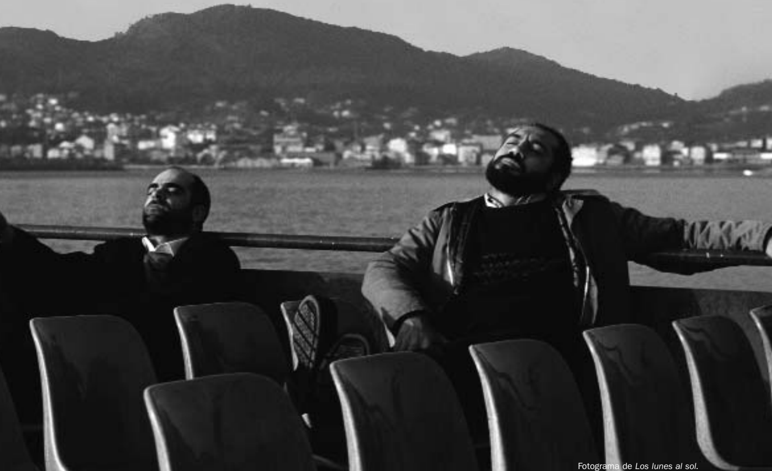
Fotograma de Los lunes al sol .