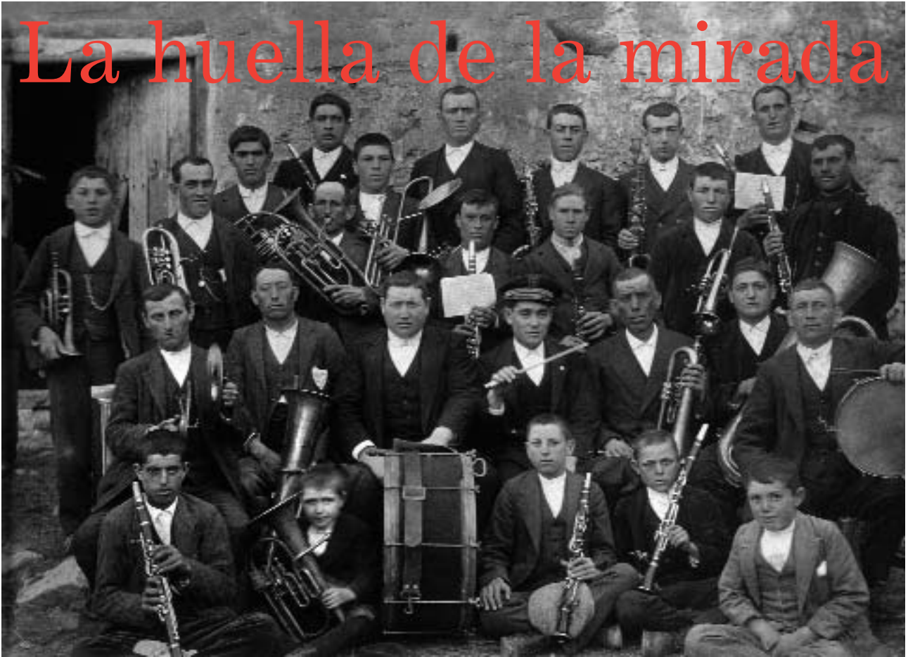
Banda de Casasimarro, una de las fotografías presentes en la exposición «La huella de la mirada».