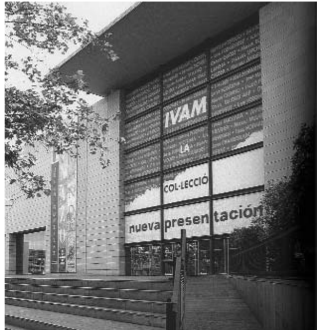
Fachada del Institut Valencià d'Art Modern (IVAM) de Valencia.

■ «Empatía. La poética sentimental de Francisco Brines con imágenes de Carmen Calvo». En colaboración con el Institut Valencià d'Art Modern (IVAM). Itinerancia: El Cairo, del 19/7/2005 al 6/8/2005; Ammán, del 27/11/2005 al 20/12/2005, y Tetuán, del 17/5/2006 al 10/6/2006.