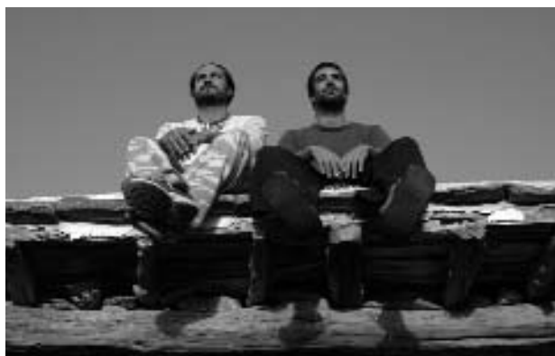
Fotograma de Aislados .