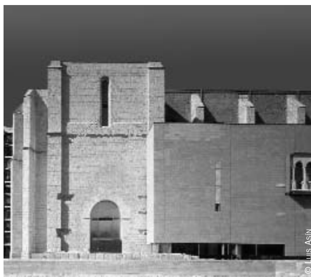
Iglesia de San Agustín.

Esta muestra visitará, entre otros, los Institutos Cervantes de Chicago, del 3 al 24 de marzo, y de Beirut, del 27 de marzo al 27 de abril.