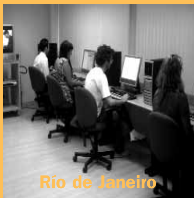
Río de Janeiro