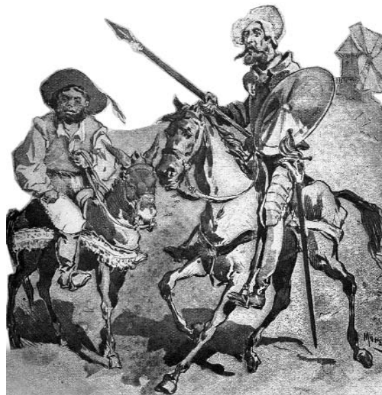
Imagen de la exposición «Leer la Mancha».

Esta exposición ha sido organizada en colaboración con la Cámara Municipal do Porto, y se mostrará en varias bibliotecas portuguesas durante este año.