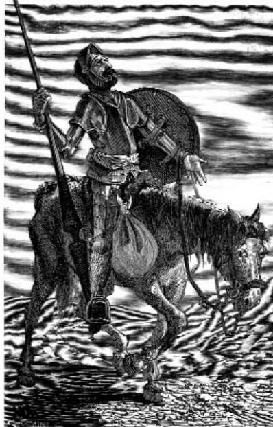
Imagen de la exposición «Leer la Mancha».