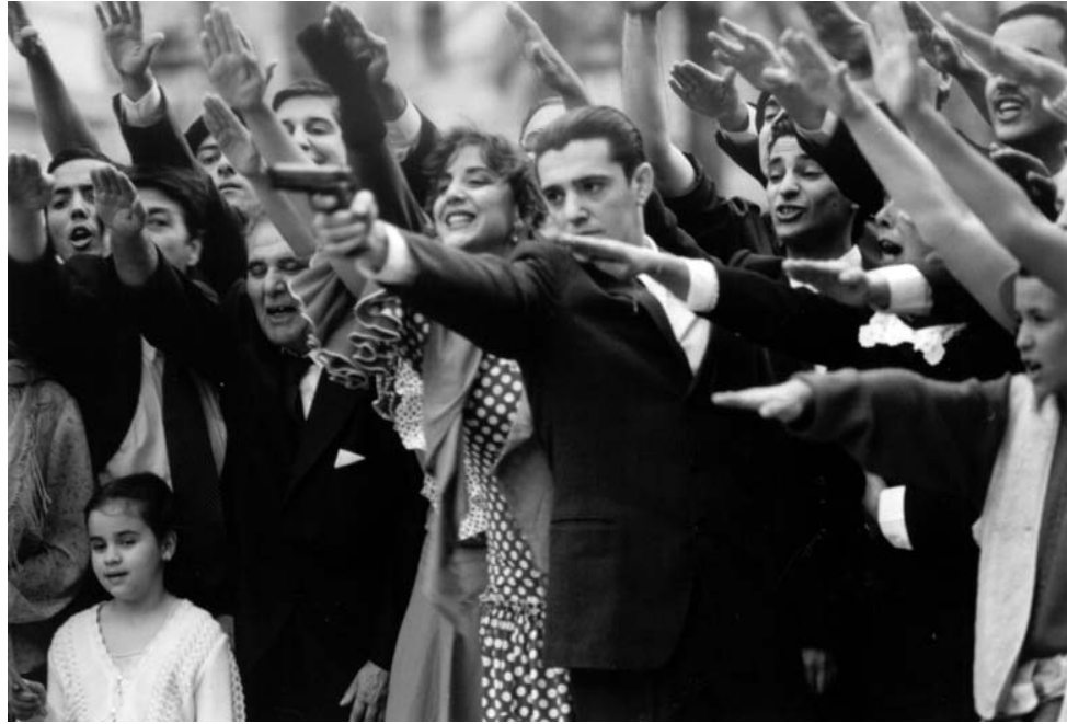
Fotograma del cortometraje La nariz de Cleopatra , de Richard Jordan.