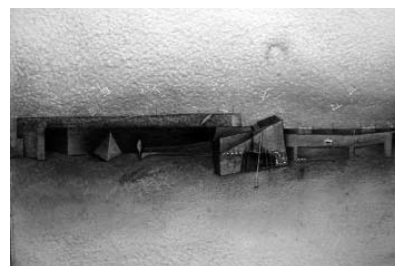
Fortificación, grabado de Paco Aguilar.

Este curso de Aguilar, director de uno de los más importantes talleres de grabado de España, Gravura, ha sido posible gracias a la colaboración de la Fundación del Foro de Arcila y la Dirección General de Cooperación y Comunicación Cultural del Ministerio de Cultura.