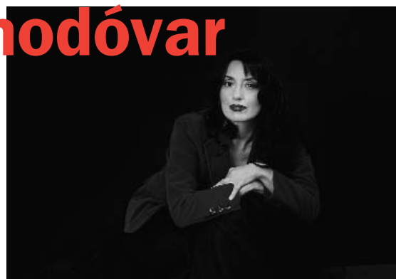
La cantante española, Luz Casal.

Cervantes, el Instituto Italiano di Cultura y el Instituto Goethe, ofrecerá hasta el 6 de agosto las creaciones artísticas más destacadas del momento, proponiendo, además, una apertura a las más diversas culturas gracias a la presencia de artistas procedentes de distintos países del mundo.