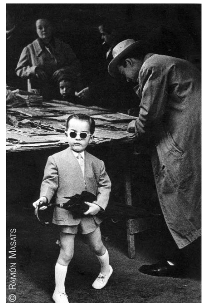
Mercado de San Antonio. Barcelona, 1955.

Organizada en colaboración con la Agencia Española de Cooperación Internacional, la editorial Lunwerg y la Association de Sauvegarde de GEM, la exposición «Fotografías de Ramón Masats», que se engloba dentro de los III Encuentros fotográficos de Ghar el Melh, podrá verse desde el 15 de julio en el Instituto Cervantes de Túnez.