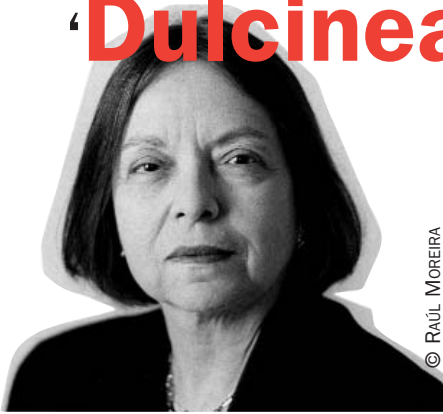
La escritora brasileña Nélida Piñón.