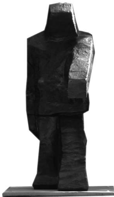
Escultura de Francisco Leiro.

Cinco esculturas monumentales de hierro fundido, Speechless I, II, III y IV , y Caracalla , se exhiben temporalmente en la plaza contigua al edificio de las Naciones Unidas en Nueva York: la Dag Hammarskjöld Plaza. El carácter introspectivo de este trabajo sugiere la firme voluntad del artista Francisco Leiro de representar en estas obras un estado latente de contención, estado susceptible de poder estallar en cualquier momento. Desprovistas de cara, y concebidas en un inicio para su realización en granito, estas cinco sólidas esculturas monolíticas son poseedoras de una obscura sensibilidad hermética y transmiten su fuerza telúrica a través de voces todavía no escuchadas.