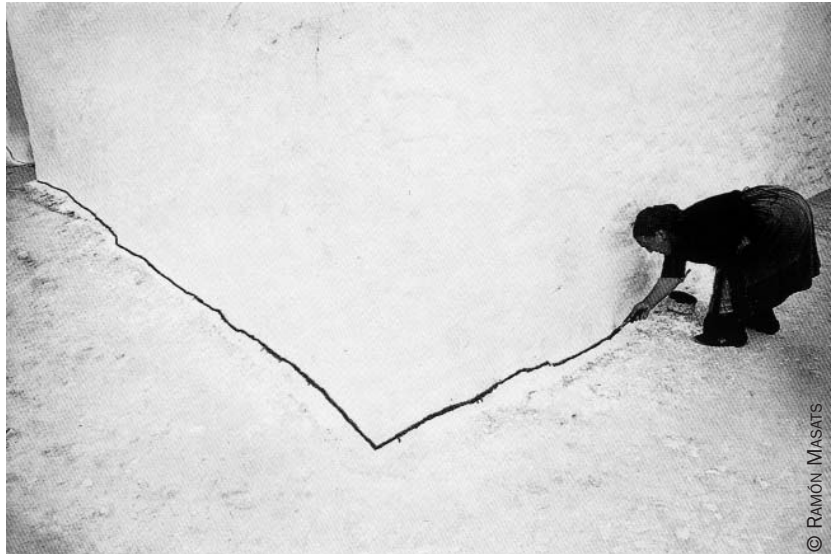
Tomelloso. Ciudad Real, 1960.