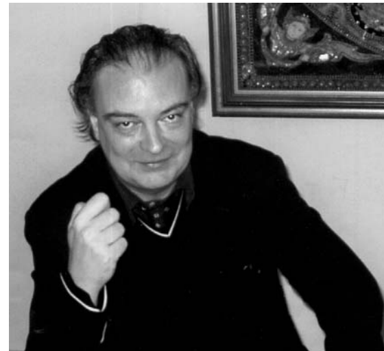
Enrique Vila-Matas, autor de Bartleby y compañía .

Las ciento seis actividades en las que hemos colaborado en el curso 2004-2005 indican con nitidez el invalorable apoyo que la Dirección General del Libro está prestando al reconocimiento, promoción y