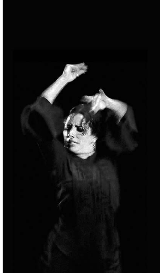
La bailaora Eva la Yerbabuena.

Este festival, que se desarrollará entre los días 14 y 21 de agosto, se completará con cursos de flamenco, de guitarra, de toque y de cante que se impartirán en la ciudad.