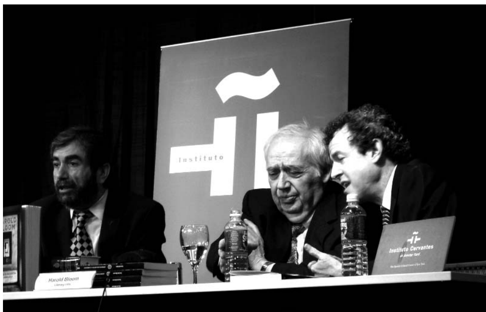
Antonio Muñoz Molina, director del Instituto Cervantes de Nueva York, y el ensayista Harold Bloom.

¿Dónde se encuentra la sabiduría? realiza un periplo literario que arranca del Libro de Job y el Eclesiastés y que continúa a través de Platón y Homero, para recorrer con admiración las creaciones de Shakespeare y Cervantes, y las conceptualizaciones de Montaigne y Bacon, Samuel Johnson y Goethe, Emerson y Nietzsche y, por último, Freud y Proust. No hay ninguna escritora dentro del canon sapiencial