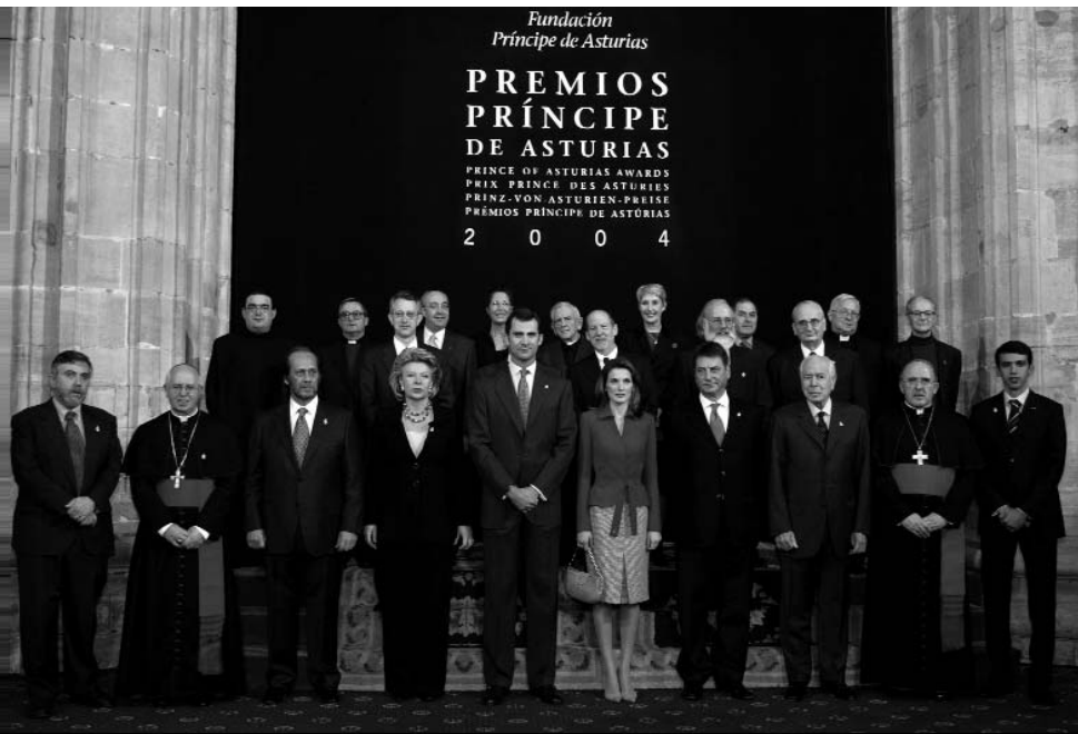
Foto oficial de los galardonados con los Premios Príncipe de Asturias 2004 (Oviedo, 22-10-2004).

El Instituto Cervantes comparte el galardón con la Alianza Francesa, la Sociedad Dante Alighieri, el British Council, el Instituto Goethe y el Instituto Camões.