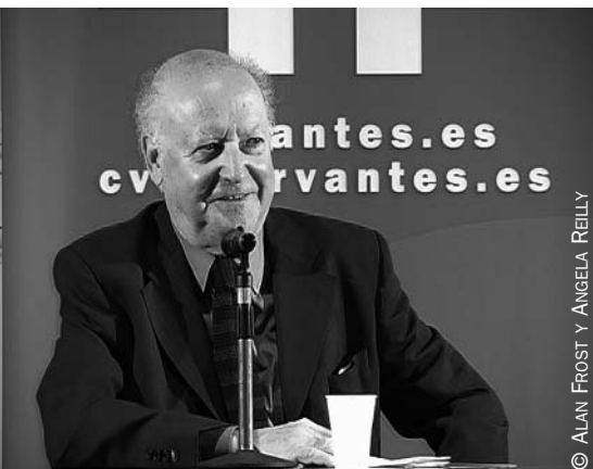
Jorge Edwards durante el acto de inauguración.

El escritor pronunció la conferencia «El quijotismo y el cervantismo».