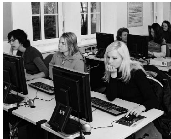
Imagen del Aula Cervantes de Liubliana.

El Aula dispone de una sala multimedia y otra sala de lectura para la consulta de fondos bibliográficos. Gracias a su labor, incluso antes de su apertura oficial, el número de matrículas para los exámenes del DELE ha crecido en Eslovenia un 50% con respecto a la convocatoria del año pasado.