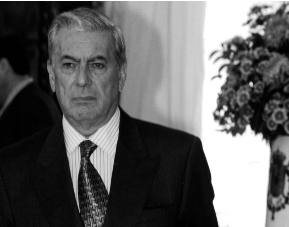
Mario Vargas Llosa.

El 9 de junio el escritor y académico Mario Vargas Llosa pronunciará, en el Instituto Cervantes de Londres, la conferencia «Los cuatrocientos años del Quijote », que se celebrará con motivo de la exposición «De loco a héroe. 400 años del Quijote », que se exhibe en la Biblioteca Británica de Londres.