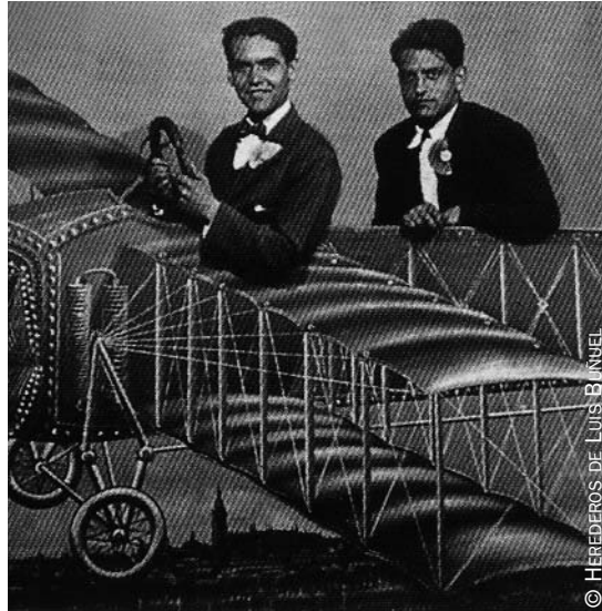
Lorca y Buñuel en la verbena de San Antonio de la Florida. Madrid, 1923.