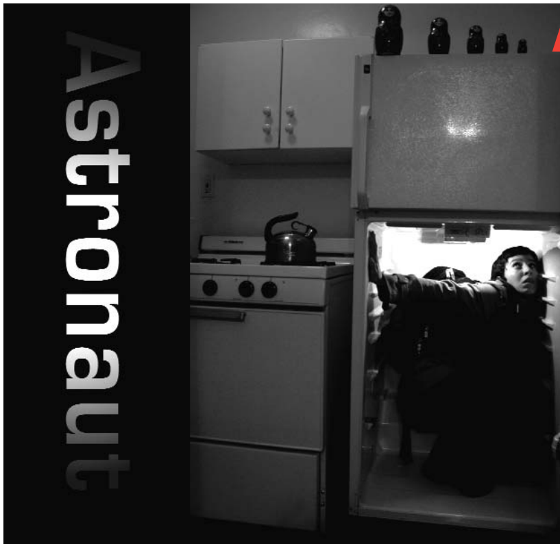
Cartel del espectáculo Astronauta .