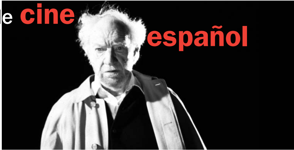
Fernando Fernán Gómez en la película En la ciudad sin límites , de Antonio Hernández.