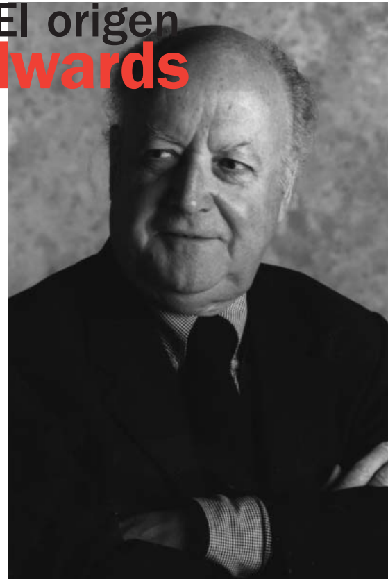
El escritor chileno Jorge Edwards.

En 1994 recibió el Premio Nacional de Literatura y se le concedió el Premio Cervantes en 1999. Es el único escritor chileno que ha logrado este galardón.