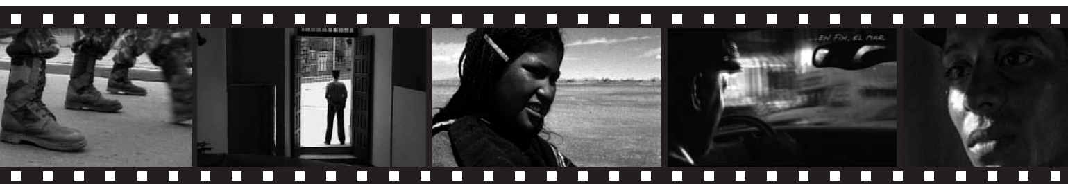
Fotogramas de Operación Algeciras (los dos primeros); Vuelve Sebastiana ; En fin, el mar y Marasmo .

A lo largo del mes de mayo, el Instituto Cervantes de Toulouse organizará una muestra de cine en la que se exhibirán películas y documentales seleccionados de la 29.ª edición del Festival de Cine