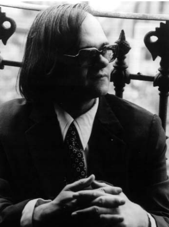
El poeta Pere Gimferrer.

El Festival de Poesía de Berlín, uno de los más destacados en Europa, es una muestra de todas las esferas del mundo poético. En él la poesía se palpa, se experimenta y se escucha. Este año, la poesía en lengua española será el tema central del festival: la pluralidad de sus tradiciones poéticas y su transculturalidad hacen de la poesía hispánica un lugar de encuentro. Entre los días 18 y 26 de junio se celebrarán, en el Instituto Cervantes de Berlín, las actividades que se relacionan a continuación.