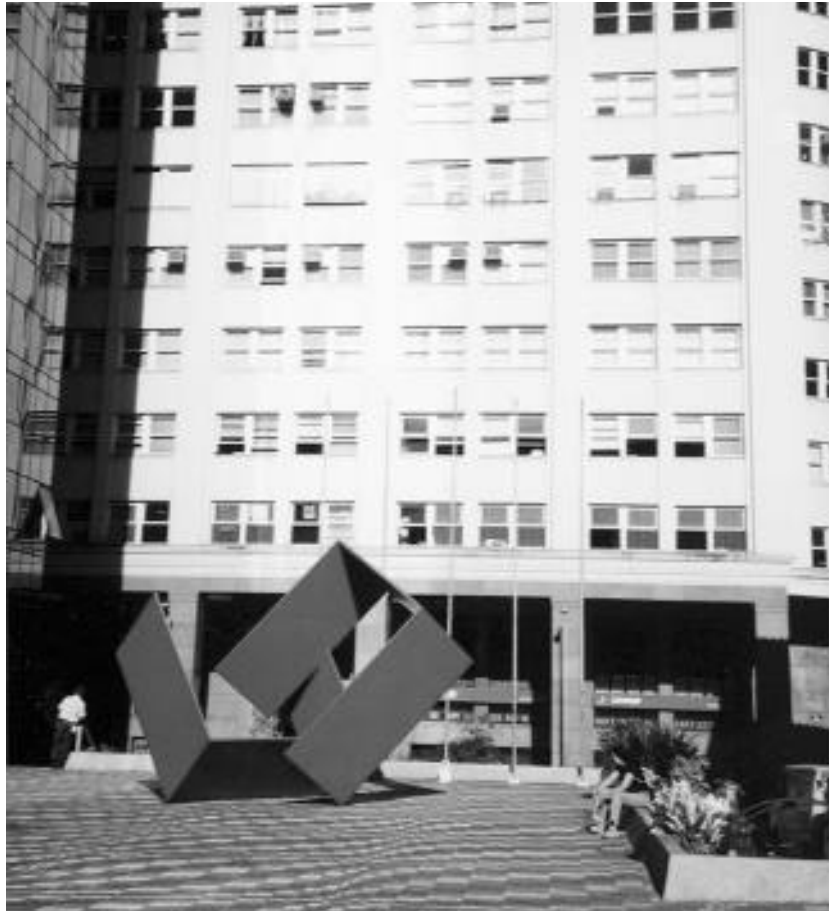
En la imagen, la sede del Instituto Cervantes en Río de Janeiro.

El Instituto Cervantes trabaja con la mayor responsabilidad para lograr un clima de cooperación y confianza que permita llevar adelante este desafiante y comprometedor proyecto. A corto plazo incrementará su presencia en el país, pues a los centros de São Paulo y Río de Janeiro se sumarán siete nuevas sedes en las ciudades de Belo Horizonte, Brasilia, Curitiba, Florianópolis, Porto Alegre, Recife y Salvador. Todo ello, sin duda, contribuirá a un mayor desarrollo de la lengua española en Brasil, a la vez que a la difusión del portugués y de la cultura lusobrasileña entre los pueblos que se expresan en español.