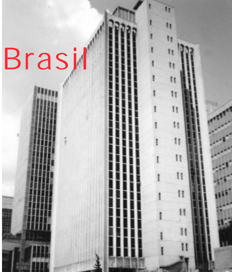
En la imagen, la sede del Instituto Cervantes en São Paulo.

El prestigio cultural, científico y lingüístico de España es evidente y las repercusiones futuras podrían ser grandes si nos detenemos a pensar en que Brasil tiene más de 50 millones de habitantes menores de quince años que potencialmente podrían ser estudiantes de español.