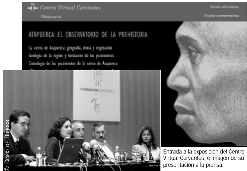
Entrada a la exposición del Centro Virtual Cervantes, e imagen de su presentación a la prensa.