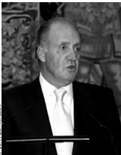
Su Majestad el Rey Don Juan Carlos.