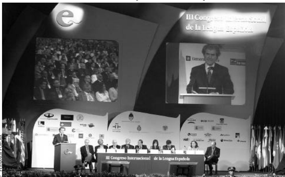
César Antonio Molina, director del Instituto Cervantes, en el acto de clausura del Congreso.