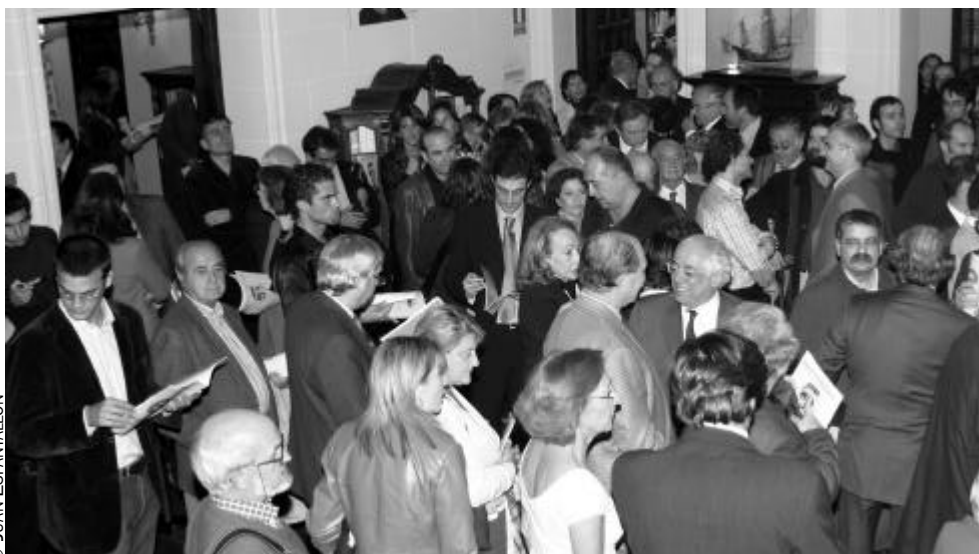
Vestíbulo del Palacio de la Trinidad, una de las sedes centrales del Instituto Cervantes, el día de la presentación de la revista.

Visitas a la revista CERVANTES desde las páginas web del Instituto Cervantes (Del 25 de octubre al 24 de noviembre de 2004)