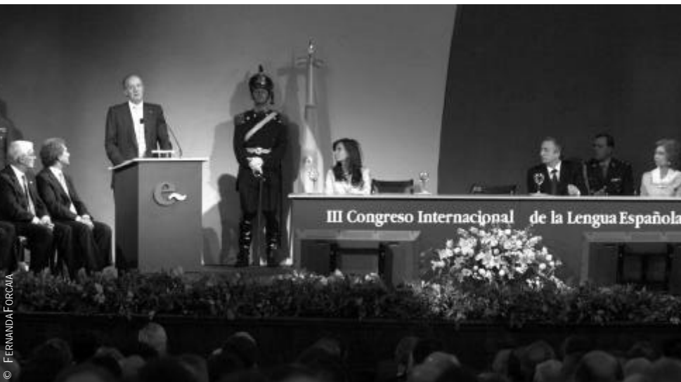
Su Majestad el Rey Don Juan Carlos inaugura el III Congreso Internacional de Lengua Española en Rosario, en presencia de Su Majestad la Reina Doña Sofía y del presidente de Argentina, Néstor Kirchner, y su esposa, la senadora Cristina Fernández.

Su Majestad el Rey Don Juan Carlos y el presidente de Argentina, Néstor Kirchner, inauguraron el 17 de noviembre de 2004 el III Congreso Internacional de la Lengua Española, que se celebró en la ciudad argentina de Rosario hasta el día 20. Ante más de 160 congresistas procedentes de todos los lugares del mundo hispánico y de los más diversos ámbitos de la cultura, la enseñanza, la comunicación y las academias, el Rey afirmó que el castellano «se hizo español ensanchando su mestizaje». «Nuestra identidad lingüística —añadió— es la suma convergente de muchas identidades».