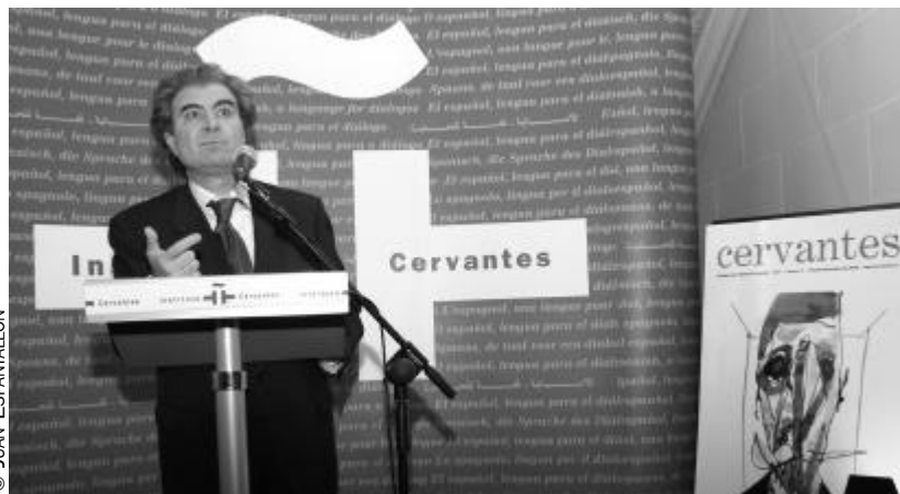
El director del Instituto Cervantes, César Antonio Molina, durante la presentación de la revista.

César Antonio Molina, director del Instituto Cervantes, presentó el pasado 25 de octubre la revista INSTITUTO CERVANTES, una nueva publicación que el Instituto ha editado, por vez primera, para dar a conocer, también en España, su labor de promoción del español, las lenguas cooficiales y la cultura española e hispanoamericana en el mundo.