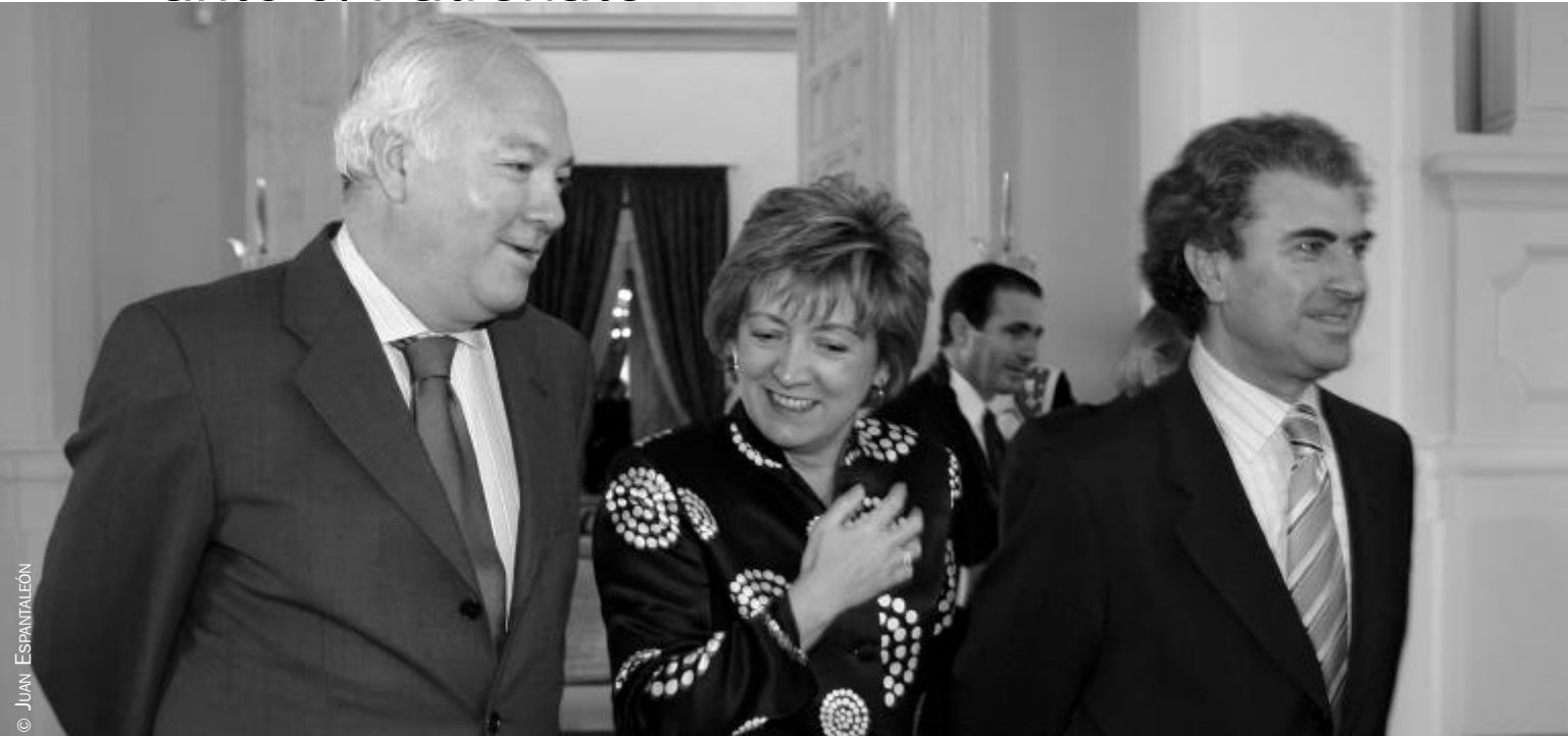
De izquierda a derecha, el ministro de Asuntos Exteriores y Cooperación, la ministra de Educación y Ciencia y el director del Instituto Cervantes.

L a cultura ha ocupado tradicionalmente un destacadísimo lugar dentro de la política exterior de España, gracias, seguramente, a la riqueza histórica y cultural de nuestro país. Lo mismo ha ocurrido con la lengua española, vehículo privilegiado de difusión de nuestra cultura, nexo de unión entre la comunidad iberoamericana de naciones y credencial de la imagen de España en el exterior.