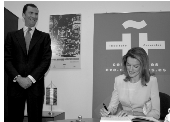
La Princesa de Asturias, doña Letizia Ortiz, firmando en el Libro de Honor del Instituto.