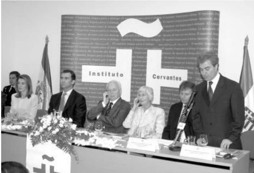
Discurso del director del Instituto Cervantes, César Antonio Molina. A su lado, el ministro húngaro del Patrimonio Cultural, el presidente de la República de Hungría y su esposa, y los Príncipes de Asturias.