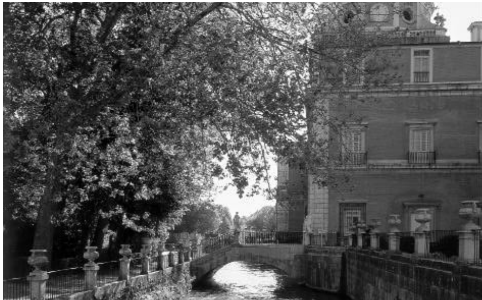
Imagen del Palacio Real de Aranjuez que albergó el Patronato del pasado 14 de octubre.

Destaca entre las novedades anunciadas el incremento de matrículas y de cursos de español que se ha registrado en el año académico que acaba de cerrarse. Se superan las 93.000 matrículas frente a las 81.689 del curso 2002-2003. La mayoría de ellas (casi 82.000) corresponden a matrículas de alumnos que estudian español, y el resto, a profesores que participaron en los cursos de formación organizados por el Instituto.