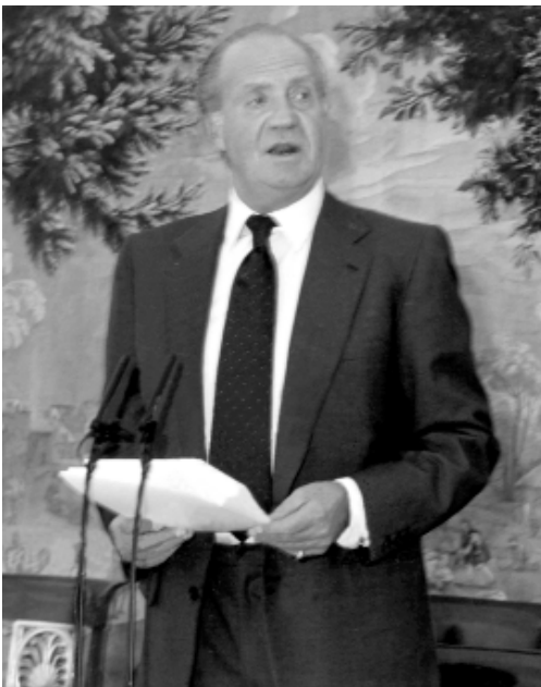
Su Majestad el Rey Don Juan Carlos durante la última reunión.

En cuanto al número de centros en el exterior, el Instituto Cervantes cuenta con un total de 42, de los cuales el más reciente es el de Budapest. Próximamente se abrirán nuevos centros en Praga (República Checa) y en Estocolmo (Suecia).