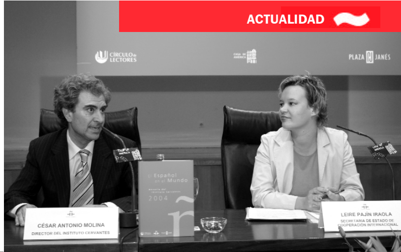
A la derecha la secretaria de Estado de Cooperación Internacional, Leire Pajín. A su lado, el director del Instituto Cervantes, César Antonio Molina.

a la situación del español en los países nórdicos, así como en Puerto Rico, Bosnia-Herzegovina y Hong Kong.