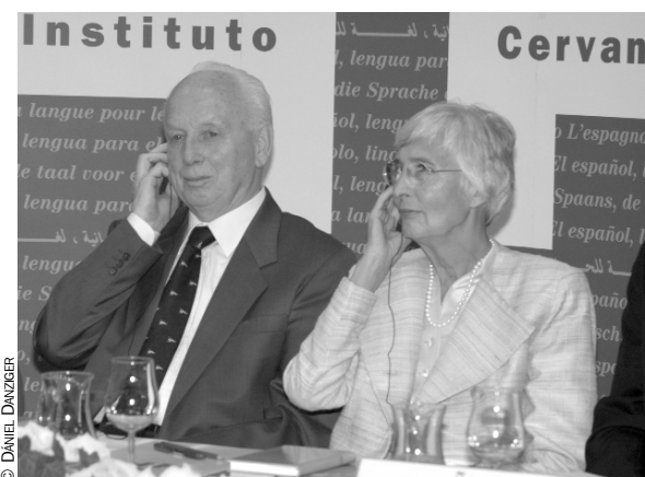
Ferenc Mádl, presidente de la República de Hungría y su esposa.

“La cultura y la educación son el mejor instrumento para el acercamiento de los pueblos”, dijo Su Alteza Real Don Felipe.