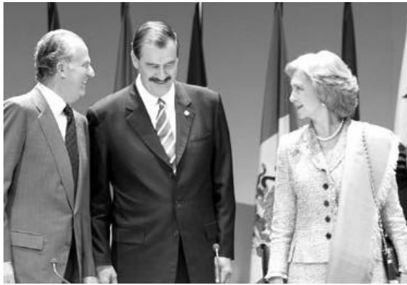
Sus Majestades los Reyes de España junto al presidente de México, Vicente Fox, en la inauguración del II Congreso de la Lengua en Valladolid.