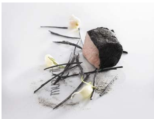
Mugaritz. Andoni Luis Aduriz. Pieza de ternera de leche asada y perfumada entre brasas de sarmiento, briznas de tomillo, cenizas, sales y rábanos crocantes.

Martes, miércoles y viernes, de 10 a 17 h. Lunes y jueves, de 12 a 19 h.